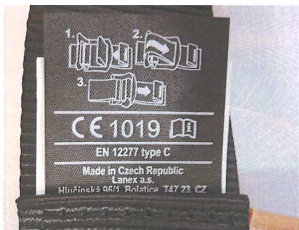
JAMMY – Značení / Marking