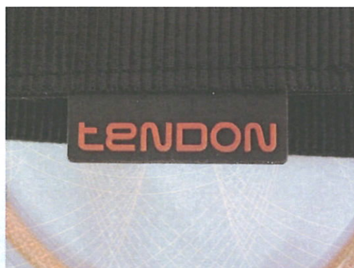
Značení / Marking