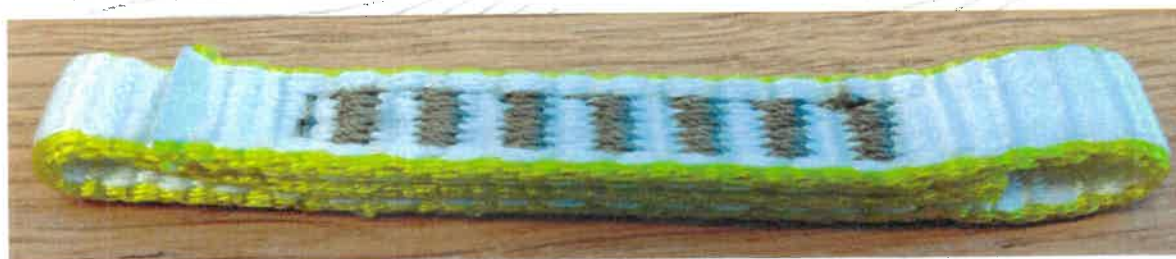
„TENDON DYNEEMA QUICKDRAW SLING 11 mm, type Slings“